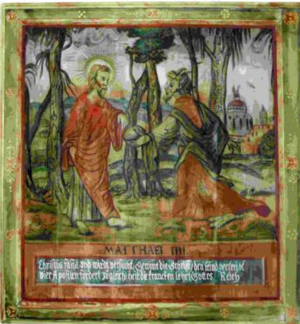
Bildtafel A5: Der Teufel versucht Jesus © Heimat- & Kultur-Pflege e.V.: Broschüre „Die Bilderdecke zu Grumbach“

erste Steinkirche, die 1609 als Einstützenhalle entscheidend erweitert und neu gestaltet wurde (Kanzel und Taufstein 1612, Altar 1689). Als Höhepunkt wurde die Decke 1674 mit 86 Bildtafeln des Alten und Neuen Testaments verziert. Die Größe einer Bildtafel beträgt 1,6 m x 1,6 m. Das Bild links zeigt das Evangelium vom 1. Fastensonntag. Die Bildschrift lautet exakt: