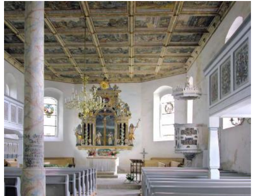
Kirche zu Grumbach

Leider war die Wilsdruffer Autobahnkirche verschlossen, so entfiel Tagespunkt 2. Das betrübte niemanden, denn