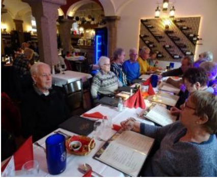
Mittagessen beim Italiener

Grumbach mit seiner wunderschönen Dorfkirche, der wohlklingenden, neuen Wegscheider-Orgel und den netten Grumbachern entschädigte uns um ein Vielfaches.