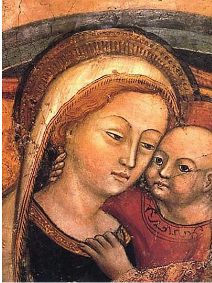
Gnadenbild der Muttergottes vom guten Rat in Genazzano

Alles möchte ich dir erzählen, alle Sorgen, die mich quälen, alle Zweifel, alle Fragen möcht ich, Mutter, zu dir tragen. Wege, die ich selbst nicht kenne, liebe Namen, die ich nenne, Schuld, die ich mir aufgeladen, anderen zugefügten Schaden. Mein Begehren, mein Verzichten und mein Schweigen und mein Richten, jedes Lassen, jede Tat, Mutter, dir vom guten Rat, leg ich alles in die Hände: Du führst es zum rechten Ende. Amen.