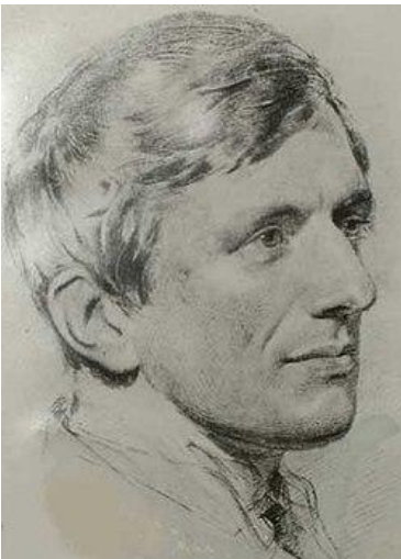
John Henry Newman /1824

kennen Viele. Auch ich habe des Öfteren einige kurze Schriften von ihm gelesen. Aber kenne ich ihn wirklich?