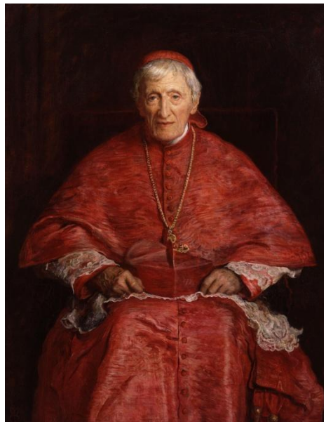
John Henry Kardinal Newman / 1881

Seine Studien von Bibel und Urkirche ließen ihn die Englische Kirche als schismatisch erkennen. Dazu kam, dass der englische König, d.h. der Staat, das Kirchenoberhaupt der Anglikaner ist. Man bedenke dabei immer, die geoffenbarte Kirche ist weder eine Monarchie noch eine Demokratie. Hier