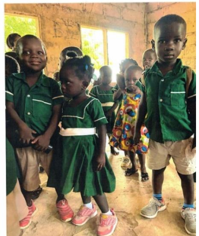
Schüler in Schultracht

ten. An der Ghanaischen Küste gab es 30 solcher Festungen, die anfangs normale Handelsstützpunkte waren und dann 300 Jahre ausschließlich dem Menschenhandel dienten. Cape Coast soll der größte Sklaven-Umschlagsplatz der Welt gewesen sein. Als Museum erinnern diese Festungen an den grausamen transatlantischen Sklavenhandel (UNESCO Weltkulturerbe). Tief erschüttert verließen unsere Freunde die Castles. Es war nicht zu verstehen, dass korrupte Menschen die Indigenen aus dem Hinterland zusammengetrieben haben, dass diese in kahlen, dunklen Kellerkern aneinander gekettet, nackt, ohne Toiletten und auch ernährungsmäßig schlecht versorgt oft drei Monate auf ein Schiff warten mussten, bevor die dann noch Überlebenden in die amerikanische Gefangen-