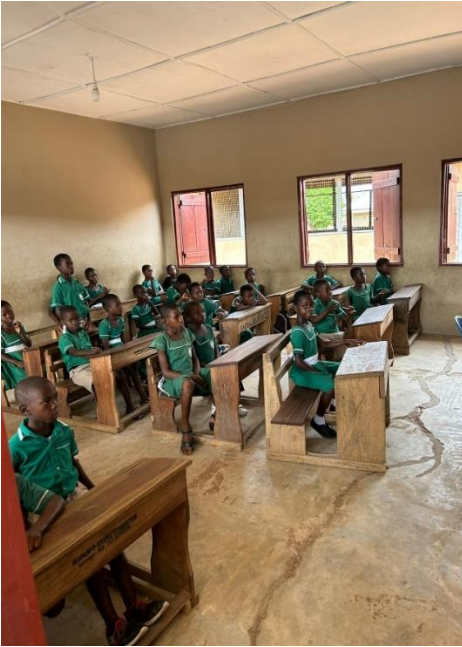
Schule in Drobonso