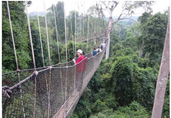
Brücke im Regenwald (Kakum Nationalpark)

Die Reisegruppe wohnte an fünf verschiedenen Orten, von denen sie jeweils sternförmig mit den zwei zur Verfügung gestellten Kraftfahrzeugen unterwegs war und so Land und Leute kennenlernen konnte. Dabei sah sie das muntere Leben auf den Märkten für Lebensmittel, Baumwoll- oder afrikanische Kunstprodukte. Sie besichtigte eine Töpferei und eine Weberei und in einem traditionellen Dorf wurde sie sogar vom „König“ empfangen, der der Dorfgemeinschaft vorstand. Sie erlebte schöne Stunden am Atlantik und im Kakum Nationalpark (3), wo sie in diesem Regenwald nördlich von Cape Coast von einem Baumkronenpfad Pflanzen und Tiere beobachten konnte.