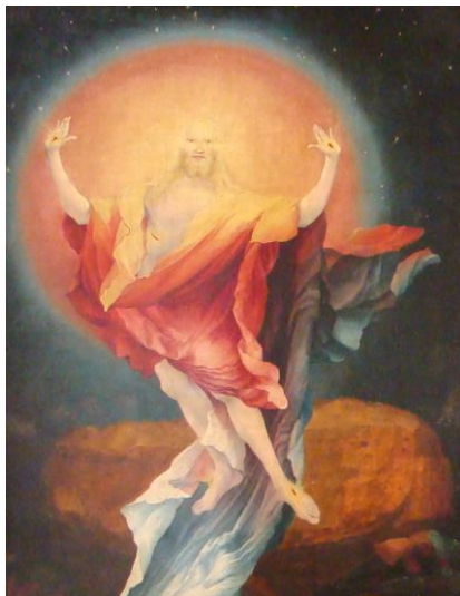
Christi Auferstehung – Isenheim Altar, Matthias Grünewald, 1516

Wirklich schlimm wird es, wenn das eigene Verhalten als Sünde gar nicht mehr als solche erkannt wird oder wenn es gar für das Gute und Richtige gehalten wird und für alle in entsprechende Paragraphen gegossen wird.