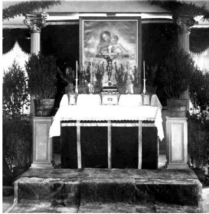
Altar am 24. Februar 1924