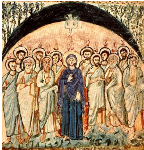
Pfingsten (Rabbula-Evangeliar, 586)

Die Wirkung des Heiligen Geistes erkennt man deutlich an den Aposteln. Nachdem Jesus in den Himmel aufgenommen worden war, fühlten sie sich allein. Die Verheißung Jesu „ihr werdet Kraft empfangen, wenn der Heilige Geist auf euch herabkommen wird“ (Apg 1,8) erfassten sie in ihrer Depression gar nicht, sie verbrachten ihre Zeit gemeinsam mit der Mutter