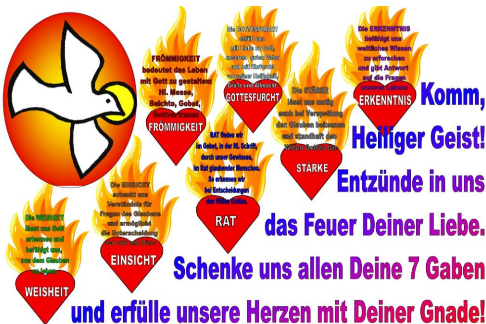
Abb.1: Die 7 Gaben des Hl. Geistes, dargestellt auf der Pfingst-Wandtafel von 2010

Über den Heiligen Geist haben wir schon kurz in den ersten beiden Teilen nachgedacht. Die Dreifaltigkeit ist das große Mysterium, ein Gott und doch drei Personen: Gott-Vater, der Schöpfer aller Dinge, wollte unsere Erlösung und sandte uns deshalb seinen Sohn. Der Heilige Geist ist die Liebe zwischen Gott und Jesus Christus. Nach unserem irdischen Tod werden wir alles genau wissen. Jetzt habe ich als Physikerin nur ein symbolisches Bild für unsere schwachen Vorstellungen von Gott. Haben Sie schon eine Hochspannungsentladung erlebt? An der TU Dresden wird gelegentlich eine diesbezügliche Show präsentiert. Es ist atemberaubend, wenn man im sicheren Abstand durch die sich bläulich färbende Luft sieht, wie die gewaltigen Kräfte freiwerden. Sicher hapert der Vergleich. Aber der Heilige Geist