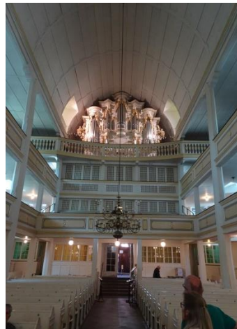
Bachkirche: Hinter dem Gitter verbirgt sich die zweite Orgel

Die Traukirche in Dornheim stammt aus dem 12. Jahrhundert. Seit 1474 wurde die Kirche wiederholt erweitert und umgebaut. 1707 heirateten hier Johann Sebastian Bach und seine Cousine 2. Grades Maria Barbara Bach. Seit 1817 mehrten sich statische Probleme an der historisch wertvollen Kirche. In Abständen wurde immer wieder versucht, die Kirche zu retten. Trotz einer umfangreichen Sanierung während der DDR-Zeit musste die Kirche 1986 erneut baupolizeilich gesperrt werden. Durch das Engagement des ganzen Dorfes wurde 1996 der Dornheimer „Freundeskreis zur Erhaltung der Traukirche von Johann Sebastian Bach e.V.“ ge-