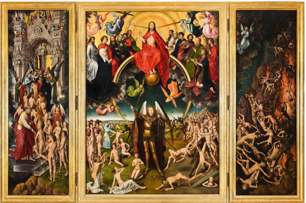
Jüngstes Gericht von Hans Memling, ca. 1470; Mitteltafel: Auferstehung der Toten und das Gericht; links: Die Gerechten via Himmel; rechts: die Verdammten via Hölle