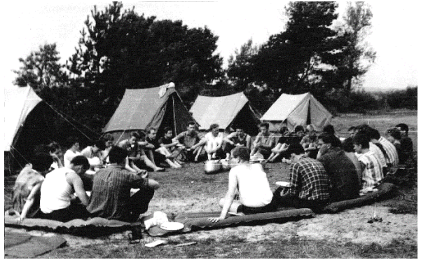
80 Studenten erholten sich pro Jahr auf der „Insel“ – bis es die Stasi erfuhr und verbot.