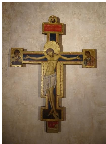
Kruzifix / Giunta Pisano (ca. 1235 / S. Maria d. Angeli / Assisi)

Und was ist am Karsamstag? Trauer. Jesus ist nicht mehr da. Der Altar ist kahl, keine Blumen oder Kerzen, der Tabernakel ist geöffnet und leer – Trauer umfängt die Apostel – und auch uns. Wir trauern auch über unsere Schuld, denn Jesus hat den schmerzvollen Tod auf sich genommen für die Verfehlungen aller Menschen, d.h. inklusive für die Schuld der Menschen der vorchristlichen Zeit, die sich in „der äußersten Gottverlassenheit“ befanden. Deshalb stieg Jesus hinab in das Reich des Todes, um auch diese