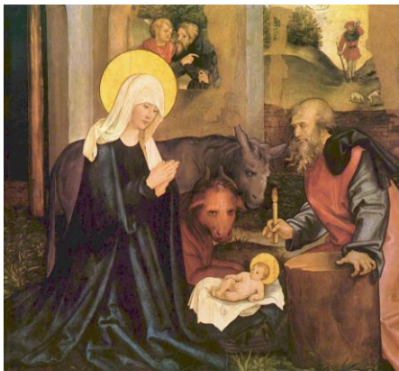
Christi Geburt, Hans Schüpflein, 1506 ©gemeinfrei

Wie erlebten Sie Ihre Mutter während Ihrer Kindheit? Auf mich hatte Mutter einen großen Einfluss. Sie hörte mir zu, sie war immer für mich da, nahm mich in ihre Arme – und schon war mein Kummer verfliegen. Für mich war sie ein Abbild der Mutter Gottes. Vermutlich ging es vielen Menschen so, denn sonst wäre Maria nicht von Anfang an in so hohem Maße verehrt worden. Dabei kommt Maria doch relativ