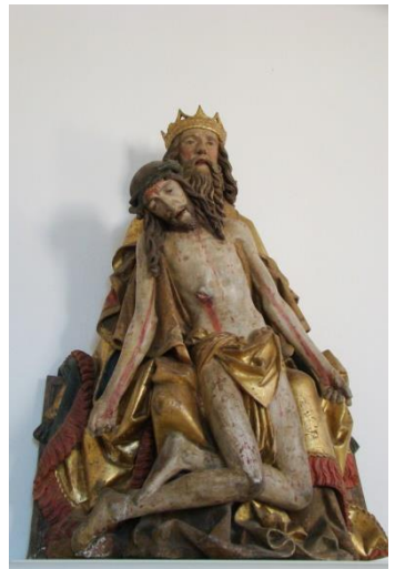
„Gnadenstuhl“ im Mittelalter eine beliebte Darstellung, Bad Buchau

Eines Wesens bedeutet, Jesus ist Gott und ist es auch von Anbeginn an - und trotzdem sagt Jesus einmal, Gott Vater sei größer als er. Unsere