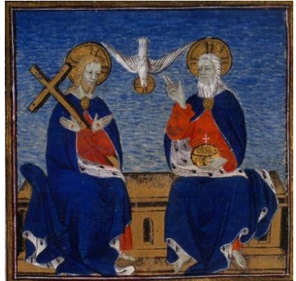
Dreifaltigkeit / französische Bibel, 15. Jh. ©gemeinfrei