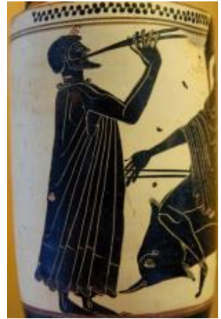
Ein Mann spielt auf dem Aulos, dem antiken Rohrblattinstrument (Sizilien, ca. 480 v. Chr., © Marie-Lan Nguyen / CC BY 2,5)

Seit dem Corona-Lockdown-Jahr wissen wir alle, dass es nicht genügt, nur zu essen und Fußball anzuschauen. Wir vermissen schmerzlich die Kultur. Das ist offensichtlich ein ganz elementarer menschlicher Wunsch, denn bereits vor rund 42.000 Jahren haben die Steinzeitmenschen Flöten aus Vogelknochen gefertigt. Im Prähistorischen Museum zu Blaubeuren kann man z.B. so ein Exemplar aus einer Höhle der Schwäbischen Alb bewundern. Rohrblattinstrumente sind als Grabbeigaben aus dem Mittleren Reich des Alten Ägypten (2010–1793 v. Chr.) erhalten. Meist handelt es sich aber um Abbildungen. Zwei gleichzeitig angeblasene Flöten finden wir im Alten Ägypten sogar ab der 4. Dynastie (2639–2504 v. Chr.). Eine Bronze- statuette bläst auf drei Rohrblattinstrumenten (Sardinien, ca. 1000 v. Chr.), das ähnelt einer Launeddas, wie sie dort heute noch in Gebrauch ist.