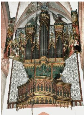
Orgel in Kiedrich (1500)

Bereits Mitte des 12. Jahrhunderts wurde die Orgel für die christliche Liturgie unverzichtbar. Und ihre Funktionalität wurde seitdem kontinuierlich weiterentwickelt. So wurde das Spielen durch Tastaturen erleichtert: Ein Tastendruck bewirkte nun über sehr einfache Trakturen das Öffnen einer entsprechenden Pfeife und der Wind hatte freie Bahn, der Ton erklang. Wählbare Register gab es zu dieser Zeit noch nicht, d.h. eine anfangs festgelegte Pfeifenzuordnung bestimmte den Klang im sogenannten „Blockwerk“. Die Erfindung der Schleiflade im 14. Jahrhundert ermöglichte dann, mehrere Register anzusteuern und so die Klangvielfalt gravierend zu erhöhen. Alle weiteren Änderungen basieren auf diesen Grundlagen. Der Orgelbauer legt aufgrund des Auftraggebers, der gegebenen Raumakustik und der finanziellen Mittel die Gesamtanlage einer Orgel, die sogenannte Disposition, fest. D.h. Festlegung der einzelnen Register, der Technik (Spieltisch inkl. Manuale/Pedal, Traktur – mechanisch, pneumatisch oder elektrisch –, Windlade, Windwerk,) und der verwendeten Stimmung sowie der äußeren Gestaltung der Orgel durch den Prospekt. So hat die heute größte Orgel der Welt 314 Register, 33.114 Pfeifen und 7 Manuale (Atlantic City im USA-Bundesstaat New Jersey).