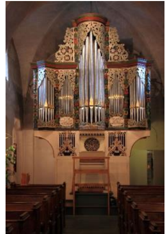
Gotische Orgel Ostönnen (ca. 1425-1431)