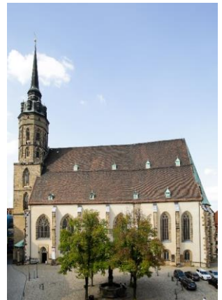
Der Dom zu Bautzen

Quellen: [1] Bistum Dresden-Meißen, [2] Heiligenlexikon, [3] Kathpedia, [4] Wikipedia, [5] Geschichte der kath. Pfarrei Meißen; [6] Geschichte der kath. Pfarrei Herz Jesu Dresden