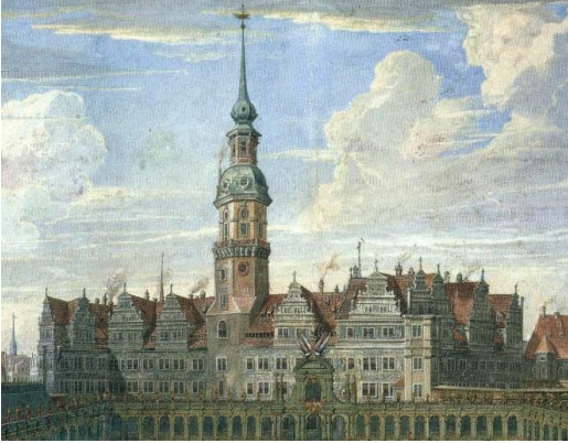
Dresdner Residenzschloss 1709

Im albertinischen Sachsen änderte sich die kirchliche Situation sehr langsam. Der Schlossbezirk wurde quasi ein exterritoriales katholisches Gebiet. Viele Gesandte und Bedienstete waren katholisch. In der Moritzburger Schlosskapelle konnte 1699 zum ersten Mal öffentlich katholischer Gottesdienst gefeiert werden. 1708 hatte dann auch Dresden eine eigene kleine Hof- und Pfarrkirche. Gleichzeitig setzte Papst Klemens XI. den Jesuitenpater Moritz Vota zum „Präfekten der katholischen Mission in Sachsen“ ein.