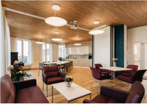
Blick in Gemeinschaftsraum und Küche

willkommen. Dabei stehen die Mitarbeiter Angehörigen genauso zur Seite wie den Hospizgästen selbst und unterstützen in krisenhaften Situationen von Krankheit, Sterben, Tod und Trauer. Ein „Raum der Stille“ bietet allen Menschen im Hospiz eine Möglichkeit zum Rückzug, für Besinnung, Meditation oder Gebet.