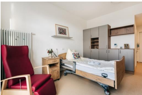
Zimmer im Hospiz

selbstverständlich mitgebracht werden und schaffen eine vertraute Atmosphäre. Die Wünsche und Bedürfnisse der Hospizgäste bestimmen den gesamten Tagesablauf. So gibt es einen begründeten Innenhof und ein Wohnzimmer mit Wohnküche fürs gemeinsame Kochen, Backen, Essen, aber auch zum Feiern. Familie und Nahestehende sind für die Unterstützung der Hospizgäste immens wichtig und sind im Hospiz jederzeit