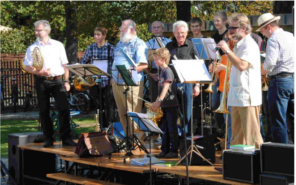
Der evangelische Posaunenchor zu unserem Kirchweihfest 2011.