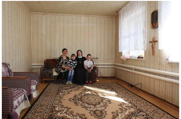
Sessel und Sofa holt der ehem. Besitzer noch ab.

Dieser Tage machte ich mit Schwester Helena aus Marx meinen ersten Besuch bei einer Frau, die vier Kinder ihrer verstorbenen Schwester angenommen hatte, damit denen der Weg in die Zukunft offen bliebe. Ihre eigenen Töchter sind schon aus dem Haus. Sie ist arm und in ihren selbstlosen Plänen auf viel Hilfe angewiesen.