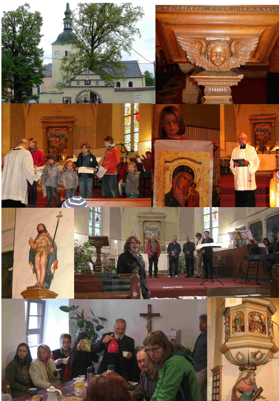
HEILIGE MARIA, MUTTER GOTTES, BITTE FÜR UNS.

DIE MUSIKALISCHE GESTALTUNG SOWIE AN M. LASKE FÜR DIE ORGANISATORISCHE VORBEREITUNG!