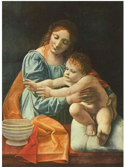
Maria mit dem Kind, Giovanni Antonio Boltraffio