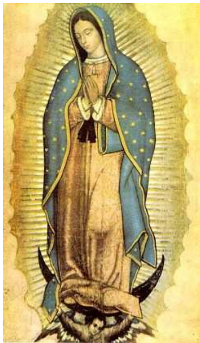
Gnadenbild von Guadalupe/Mexico

Der zweite Aspekt liegt direkt in der Gottesnatur Jesu Christi. „Das Wort ist Fleisch geworden, nicht aus dem Willen des Fleisches, nicht aus dem Willen des Mannes, sondern aus Gott geboren“ (Joh 1,13). Für Gott ist kein Ding unmöglich. Er hat alle Gesetze dieser Welt geschaffen, er – und nur er – kann diese auch wieder aufheben, nur er kann deshalb Wunder vollbringen. Das bedeutet beispielsweise, auch rein biologisch ist eine Jungfrauengeburt möglich. Nur denke ich, die Menschwerdung