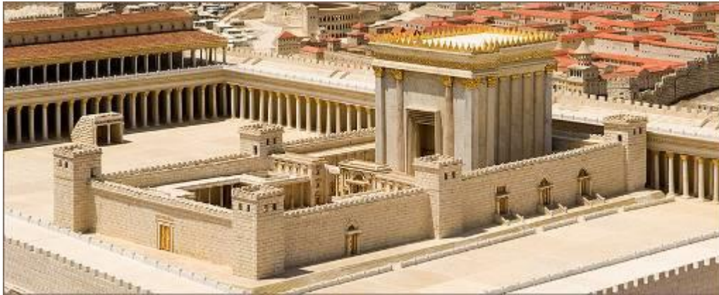
Israel-Museum: Modell der inneren Tempelanlage vor der Zerstörung im Jahre 70 durch Titus.

Und damit komme ich zu den ebenso hässlichen wie eindrucksvollen Erlebnissen unserer Reise. Als Deutsche sind wir ja besonderes sensibel für Einschränkung der Freiheit, für Grenzsicherung und Mauern. Und da wirken der Bau der Mauer um die palästinensischen Autonomiegebiete, der sichtbare Umgang der Israelis mit den Palästinensern, die vielen Grenzkontrollpunkte an den Grenzen der wie ein Flickenteppich zerrissenen Autonomiegebiete, die Inbesitznahme palästinensischen Territoriums durch die Israelis wie ein Gegengewicht zu den auf dieser Reise erlebten Schönheiten, den unbeschreiblichen Schönheiten.