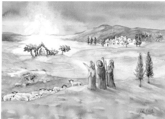
Aquarell: Christa Dick 3172 Niederwangen BE

Mühselige Hirten, doch die Ersten heute, und in den Lüften klingt es süß und mild. Verlorne Töne und der Engel Lied: Dem Höchsten Ehr und allen Menschen Frieden, die eines guten Willens sind.