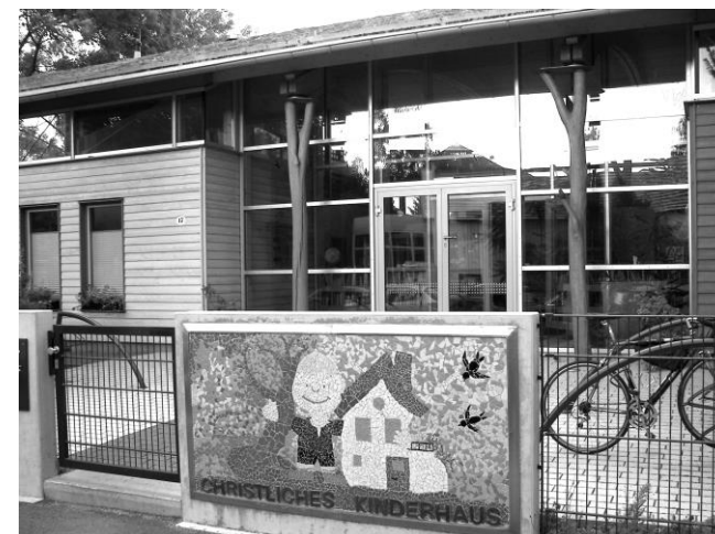
Eingangsseite des Kinderhauses

Mit weiteren, auch gemeindeoffenen Veranstaltungen ging es das Kindergartenjahr hindurch. So möchte ich nochmals an den Heinz-Rühmann-Abend im Dezember erinnern. Diejenigen, die an diesem Abend dabei waren, haben ihn sicher in guter Erinnerung. Oder an den Tanzabend im April, wo unter den Klängen der Band wieder eifrige Tänzer im Foyer herumwirbelten.