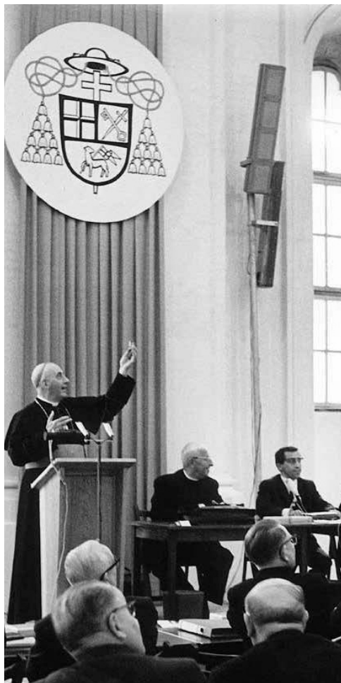
Im Juni 1969 wurde durch Bischof Otto Spülbeck (von 1958 bis 1970 Bischof von Meißen) in der Konkathedrale des Bistums die Meißner Synode eröffnet. Sie war eine der ersten Diözesansynoden nach dem 1965 beendeten II. Vaticanums.

Die Konstitutionen des II. Vatikanischen Konzils sind auch 60 Jahre danach noch immer aktuell. Wer sich darin vertieft, wird dankbar sein, zur katholischen Kirche zu gehören, wird im Glauben an die Liebe Gottes gestärkt, und wird auf dem Weg zur Heiligkeit bewusster voranschreiten.