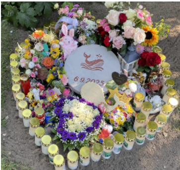
Vom Friedhofspersonal arrangiertes Grab