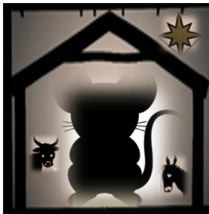
Krippenandacht mit Maus

im Oktober nicht statt, und aus dem November ist aufgrund des sehr frühen Redaktionschlusses für den vorliegenden Gemeindebrief leider noch nichts zu berichten. Dafür werfen diverse Ereignisse im kommenden