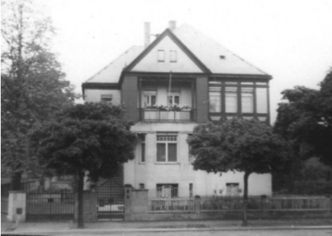
Kinderhaus in der Zeit 1948-1956