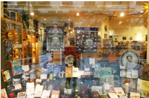
Schaufenster der St.-Benno-Buchhandlung 2020