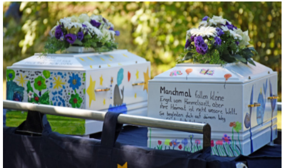
Von Familien liebevoll bemalte Särge