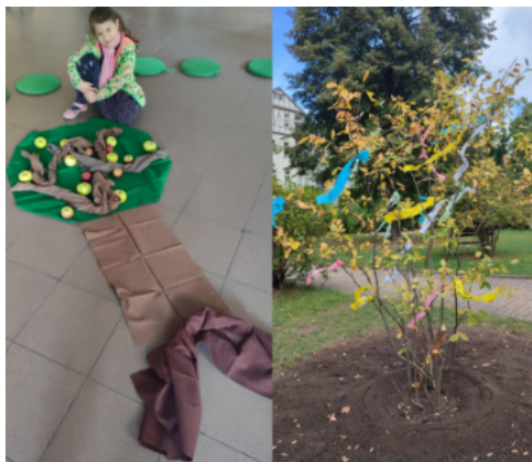
Bäume in der Kinderkirche

Mit dem vergangenen Oktober und den darin verorteten Herbstferien erfuhr unser Kinderprogramm eine sehr ruhige Zeit. Das Highlight bildete die Kinderkirche zum Erntedank, die sich in diesem Jahr den Bäumen widmete.