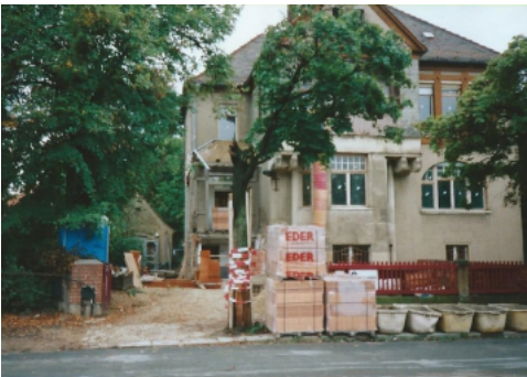
Kinderhaus Sommer 1998

Wir sollten nicht so viele Ängste in uns zulassen. Mut – wer Christ ist, hat auch Mut!“