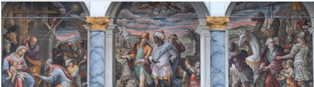
Die Weihnachtsgeschichte im Altan des Dresdner Schlosshofes der Brüder Benetto und Gabriele Tola (16. Jh.)