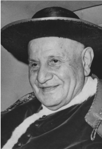
Papst Johannes XXIII.

„Macht die Fenster der Kirche weit auf!“ Mit diesen Worten soll Papst Johannes XXIII. die Idee zu einem Konzil formuliert haben. Egal, ob sie so je ausgesprochen wurden, fassen diese Worte prägnant zusammen, was sein Anliegen war: Die katholische Kirche sollte sich öffnen für die Situation der Gegenwart. Sie sollte Zeitgenossin werden. Der Papst forderte ein "aggiornamento", eine Wiederannäherung der Kirche an die Erfordernisse der Zeit.