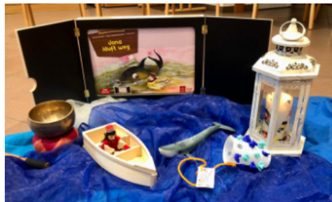
Weglaufen geht nicht