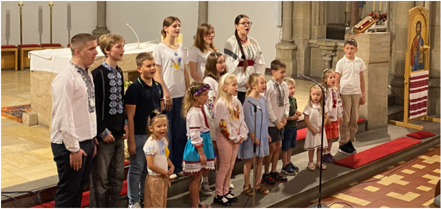
Der ukrainische Kinder- und Jugendchor