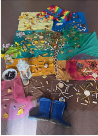
Die Jahresuhr steht niemals still

Beim Kindersamstag hieß es: „Alle Wege führen nach Rom“. Im Heiligen Jahr wollten auch wir es nicht nehmen, „Pilger der Hoffnung“ zu werden. Da es, wie wir