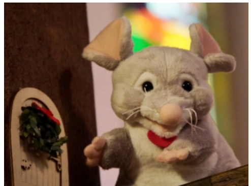
Professor Mus Ecclesius