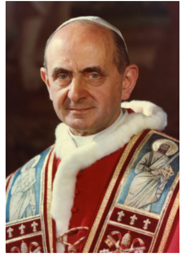
Papst Paul VI.

Die veränderte Liturgie, die sogar Folgen für den Umbau des Kirchenraumes hatte, ist sicher die sichtbarste Folge dieses Konzils. Aber auch andere Ergebnisse sind von Bedeutung: So nahm das Konzil Impulse auf, sich verstärkt dem Wort Gottes zuzuwenden. In der Messfeier soll nicht nur das Sakrament des Altares die Gemeinde nähren, sondern auch der Tisch des Wortes reichhaltiger gedeckt sein. So wurde der dreijährige Lesezyklus eingerichtet, der seitdem gilt: Die biblischen Texte jeden Sonntag umfassen in der Regel eine Lesung aus dem Alten Testament, einen Psalm, eine neutestamentliche Lesung und ein Evangelium. Das Konzil nahm den Forschungsstand auf und bestätigte, dass die Hl. Schrift nicht zu naiv als Wort Gottes zu verstehen ist, so als habe Gott den Text persönlich diktiert, sondern als „Gottes Wort in