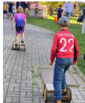
Spiele für die Kinder

chen gab es da auch Kesselgulasch und Schaschlik-Spieße vom Feinsten. Und für die Kinder war der Zuckerwatte-Stand wieder einmal der Hit. Ein herzliches „Dankeschön“