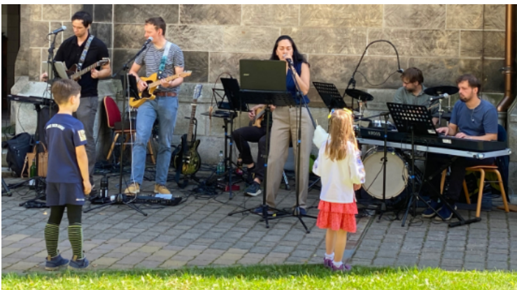
Band „Plan Y“

sei an dieser Stelle allen Organisatoren und Helfern ausgesprochen: Sie haben sehr vielen Menschen einen frohen Sonntag bereitet. Vergelt's Gott. je