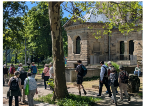
Nahezu unvermindert über die gesamte Wegstrecke hinweg ca. 70 Christen auf dem Pilgerweg

le, von ihm als „Anders-Ort“ bezeichnet, ein Raum für Rückzug und Gebet. Wir erfuhren viel Interessantes zum Gebäude, der Architektur und den Materialien sowie die Geschichte und den aktuellen Aufgaben der Krankenhausseelsorge. Pfarrer Tammer und er wiesen auch empfehlend auf den Freitagsgottesdienst um 16:30 Uhr hin, der allen offen steht.