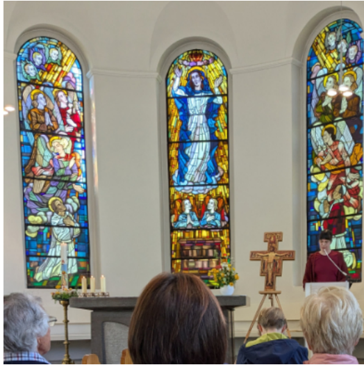
Mit der Kreuzikone auf den Weg gestartet