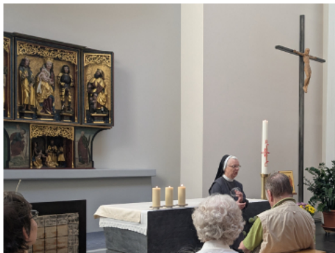
Ort der Betrachtung und Sammlung: Die Schwesternkapelle im St. Joseph-Stift

So wurde es über den Weg zur Pfarreigrenze Nachmittag und Zeit für einen Kaffee, den uns die aufmerksamen Helferinnen in der Cafeteria des St. Benno-Gymnasiums vorbereitet hatten. In geteilten Gruppen unter sachkundiger Führung durch Schülerinnen lernten wir aktuelle Angebote „unserer“ katho-