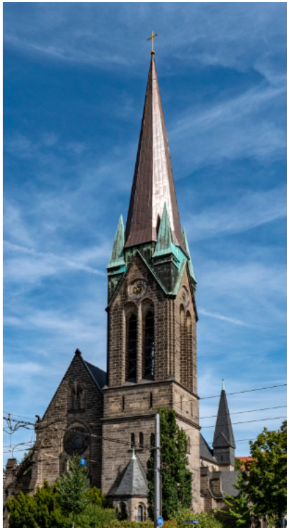
Herz-Jesu-Kirche – Pfarrkirche „St. Elisabeth“

dies verlangen, tritt der Pfarreirat an diese Stelle. Gemeinsam führen wir Klausurtagungen durch (bisher 2022 und 2024), um Probleme zu beraten und zu lösen, die uns gemeinsam betreffen.