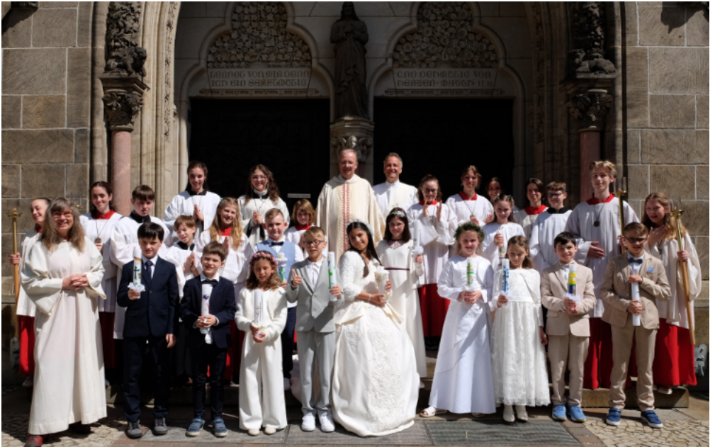
Erstkommunion in „Herz Jesu“ am 11. Mai 2025