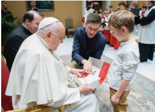
Empfang bei Franziskus, Oktober 2024

kussionen und manche spontane Äußerung ermöglichten vielfältige Interpretationen. Manche Kirchenmitglieder hat er nach einem Jahrzehnt seines Pontifikats ernüchert, wenn nicht sogar enttäuscht. Mich nicht. Vielmehr überzeugte er mich, wie er die „Enfants terribles“ der Kirche förderte, um Veränderungen voranzubringen, ohne dem Amt der Einheit die Bedeutung zu nehmen. Er stand für eine sozial-ökologische Marktwirtschaft, die in unserer Hemisphäre so normal scheint, aber auf vielen Kontinenten von der Gier Einzelner verdrängt wird.