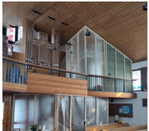
Erneuerung der Wärmedämmung in der Kirche „Heilige Familie“