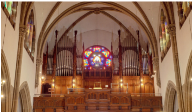
Die Jehmlichorgel in der Herz-Jesu-Kirche

Und wir bitten Sie auch in diesem Jahr um eine solche Unterstützung Ihrer Gemeinde im Rahmen Ihrer Möglichkeiten.