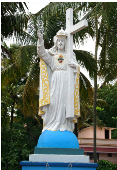
Christkönigstatue (1944) in Kanjiracode, Kerala (Indien)

Zugleich geht das Kirchenjahr zu Ende. Tod allerorten? Der letzte Sonntag im Kirchenjahr wird als „Christkönigfest“ gefeiert – trägt also kein Totengedenken im Namen. Was feiern wir da? Christus als König? Das Fest wurde 1925 von Papst Pius XI. neu eingeführt. Es stellt uns Christus als den wahren Herrscher der Welt vor Augen und damit auch als den Richter am Ende der Zeiten. Insofern ist es sinnvoll, dass es mit der Reform im Zuge des 2. Vatikanischen Konzils vom Oktober auf den letzten Sonntag im Kirchenjahr verlegt wurde. So wurde das Motiv des Festes stärker auf die Wiederkunft Christi gelenkt und der eschatologische Aspekt betont. Damit wird auch der Bogen zur Adventszeit gestaltet, in der wir uns an die erste Ankunft Christi erinnern. Ursprünglich hatte das Fest eine andere Zielrichtung: Mit der Betonung, dass Christus der Herrscher ist, wandte sich Pius XI. deutlich gegen den Laizismus (die