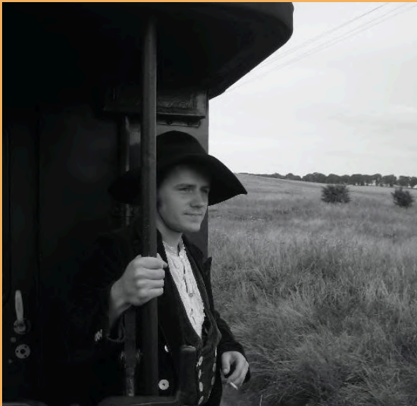
Auf der Walz