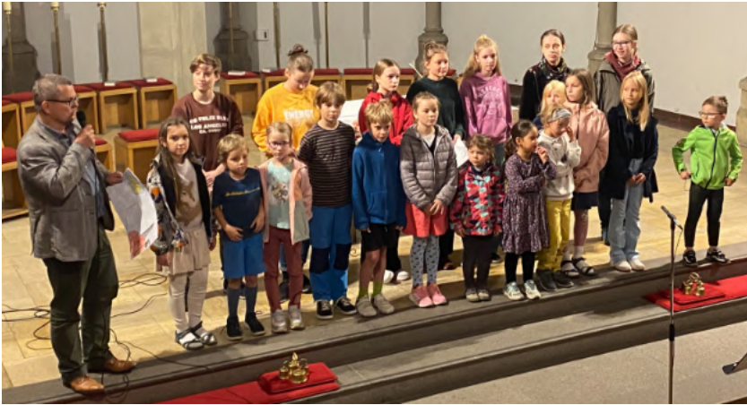
Die Kinderschola aus „Mariä Himmelfahrt“

Während die Erwachsenen noch der Musik lauschten, durften die übrigen Kinder schon im Gemeindezentrum ein Wiener Würstchen abfassen, spielen, basteln und die Zuckerwatte-Maschine ausprobieren, die auch in diesem Jahr bei Jung und Alt große Begehrlichkeiten weckte. Dann war Zeit für Gespräche und für köstliches Essen vom bunten Buffet mit Spezialitäten aus ukrainischem und deutschem Hause. Draußen wurde gegrillt und geschwätzt. Man lernte sich neu oder wieder kennen. Gegen 14 Uhr war das