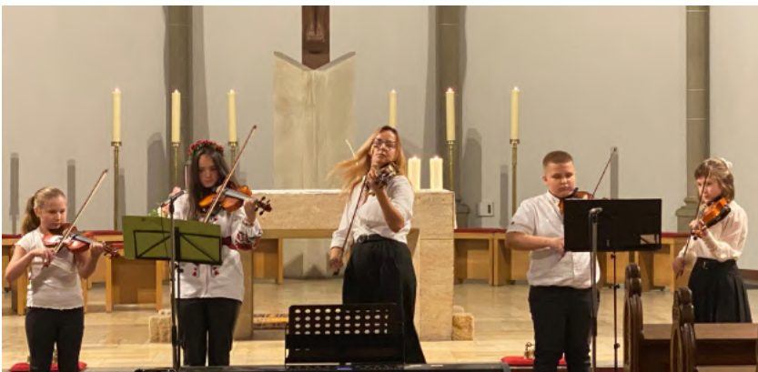
Das ukrainische Streichquintett

riante“ ließ zwar das Ökumenische Orchester und die Kinder vom Kinderhaus Arche Noah vermissen, bot aber trotzdem reichlich Programm: In der Kirche brachte sich nach unserem Kirchenchor die ukrainische Gemeinde mit einem Streichquintett sowie Gesangsbeiträgen und berührenden Volksweisen ein, bevor die Kinderschola aus Mariä Himmelfahrt mit drei fröhlichen Kinderliedern den Kulturteil ausklingen ließ. „Quaak, Quaak“ hieß es im Froschlied.