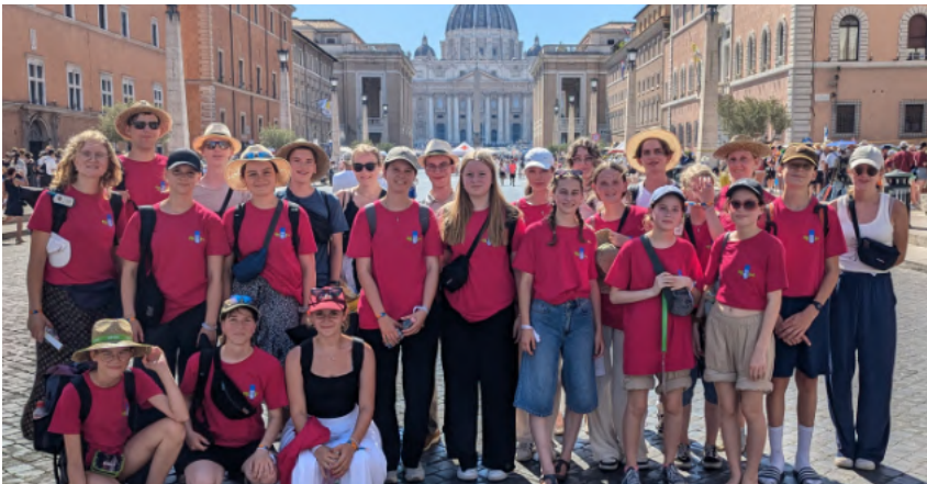
Die Pilgergruppe von „Herz Jesu“