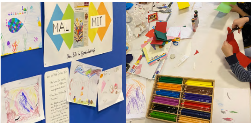
Ein Bild malen (Bilder der 5 Kinder-Künstler werden im nächsten Gemeindebrief veröffentlicht)