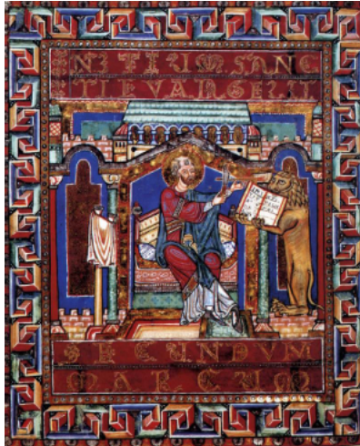
Evangeliar (12. Jahrhundert)