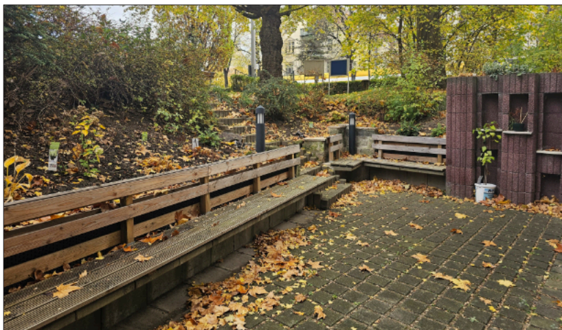
Die neuen Sitzplätze vor dem Jugendraum