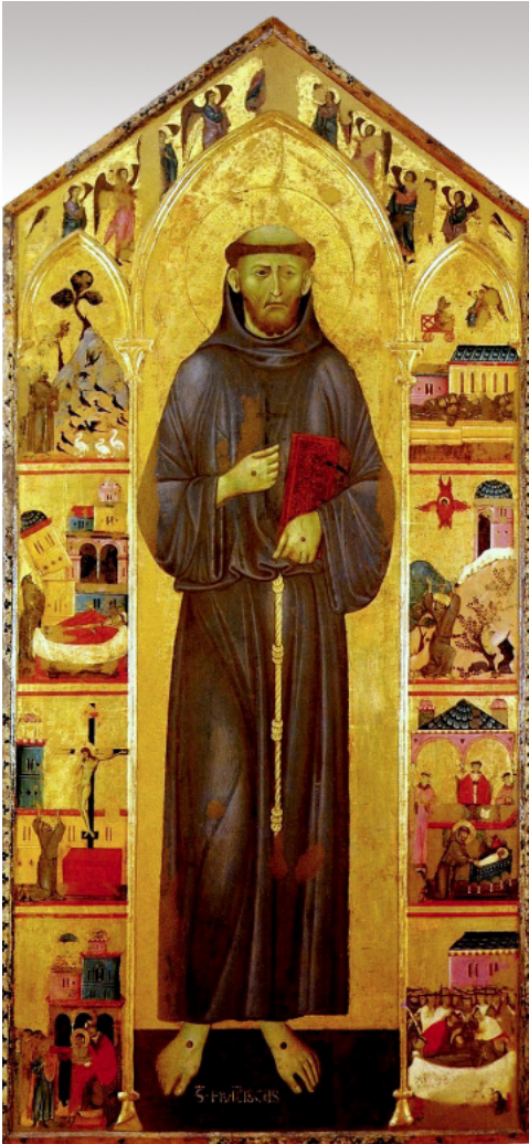
Franziskus von Assisi von Guido die Graciano