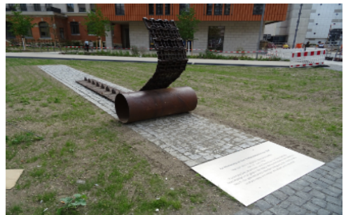
Dresdner Denkmal von Heidemarie Dreßel für den DDR-Aufstand am 17. Juni 1953

Hinter uns hörten wir Schüsse aus Maschinenpistolen und vereinzelt stürzten Menschen zu Boden. Ob sie getroffen wurden oder nur gestürzt sind, weiß ich nicht. In Höhe der Berliner Straße ließen unsere Verfolger ab und wir konnten aufgeregt aber unversehrt nach Hause laufen. Die sozialistische Presse vermeldete in den folgenden Tagen: Es war ein vom Westen inszenierter Aufruhr im Auftrag der US-amerikanischen Geheimdienste. Wir hatten etwas anderes erlebt.