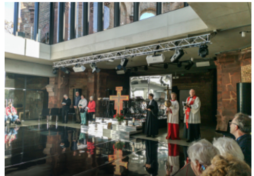
Ökumenischer Gottesdienst in der Trinitatiskirche am Reformationstag 2022

Damit interessante Angebote im kulturellen und pastoralen Bereich in beiden Gemeinden besser bekannt werden, wollen wir Veranstaltungsankündigungen zusätzlich zu den digitalen Informationen auch durch Plakate und Vermeldungen verstärkt und konsequent austauschen. So können sich hoffentlich wieder häufigere und gute persönliche Kontakte entwickeln.