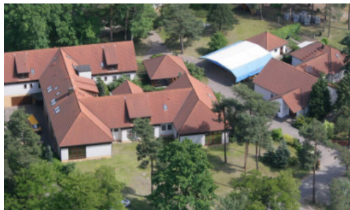
Katholische Jugendbildungsstätte Don-Bosco-Haus Neuhausen

per online-Konferenz), die von ihren Lebensbereichen erzählten. Zugeschaltet war ein Pater aus Kenia, der aus seinem Heimatland erzählte: Dort ist die Kirche viel präsenter im Alltag. Bei jeder Art von Problemen wenden sich Gemeindemitglieder