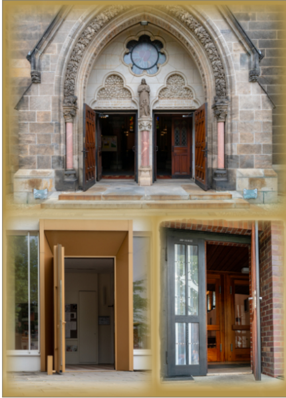
Offene Türen ...

In der Sitzung vom 3. November 2022 beschloss der Pfarreirat das Pastorkonzept von „St. Elisabeth“. Beginnend in der Klausurtagung der Ortskirchenräte entstand ein Entwurf, der durch die Arbeit der Ortskirchen und durch das Feedback der Gemeindemitglieder bereichert wurde. Das vorliegende Konzept beschreibt die generelle Ausrichtung des gesamten Lebens und den Auftrag für die Arbeit in unserer Pfarrei mit all ihren Ortskirchengemeinden. Basierend auf dem Leitwort „Nehmt einander an und seid das Licht der Welt!“ und unserer Patronin leiten sich daraus die Schwerpunkte unserer Pfarrei ab: