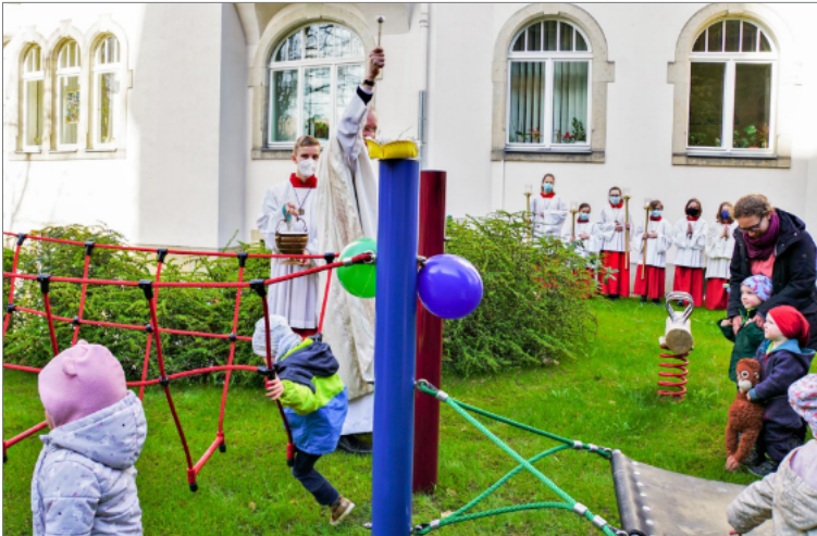
Einweihung des Spielplatzes

nanzieren, ist die freiwillige Kirchgeldspende der Gemeindeglieder eine wichtige Stütze. Wir sagen herzlich „Danke!“ allen, die sich im Laufe des Jahres daran beteiligt haben!