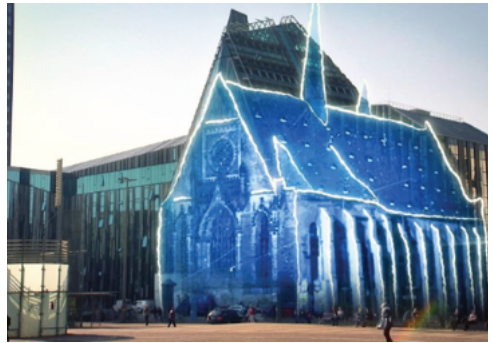
Universitätskirche Paulinum alt+neu