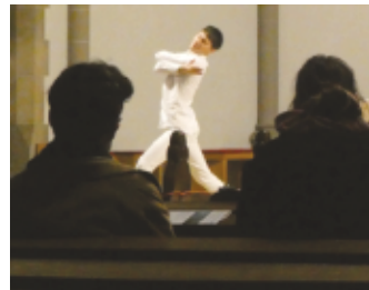
Ausdruckstanz neben dem Altar im Gottesdienst in „Herz Jesu“

Zusammenhang mit dem evangelischen Kirchentag und seinem Thema „Vertrauen wagen, damit wir leben können“ bildete