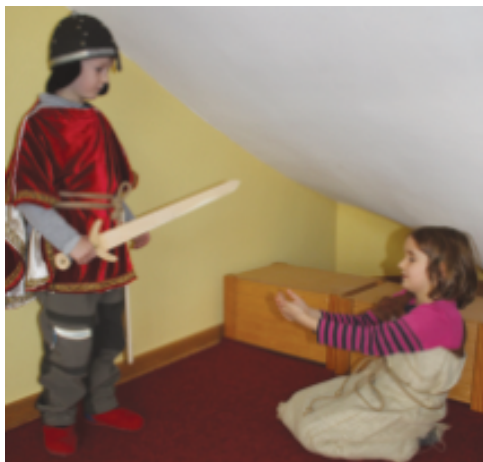
St. Martin-Feier 2020

Auch unsere Weihnachtspäckchenaktion nach Rumänien soll stattfinden. Wir wissen, dass die Menschen dort in Not sind. Noch ist es für die Initiatoren nicht ganz klar, unter welchen Maßnahmen der Transport organisiert werden kann, aber es ist so wichtig, dass diese Menschen sich nicht vergessen fühlen. Und wie wollen wir die Adventszeit im Kinderhaus erleben?