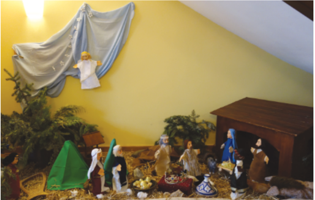
Motiv aus dem Adventsgärtlein 2019

noch duftet es im Kinderhaus ein wenig nach frisch gebackenem Kuchen, Apfelmus und Kürbissuppe. Nach dem Erntedankfest haben wir mit den Kindern geschaut, was man aus den Erntegaben alles bereiten kann; wir haben Körner gemahlen und aus Mehl Brot und Kuchen gebacken. Eine Gruppe hat fleißig Äpfel geschnitten, gekocht und gerührt und dann im Haus feinstes Apfelmus verteilt. Auch die Kürbisse wurden mit Zwiebeln und Karotten und Kartoffeln zu einer feinen Suppe. (Selbstverständlich schmeckt alles, was man selber mit zubereitet hat, richtig lecker.) Die dunklere Jahreszeit hat nun begonnen, die Tage werden spürbar kürzer und die Zeiten, die wir in Räumen verbringen, länger und intensiver.