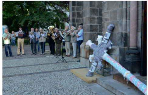
Musikalische ökumenische Unterstützung von der Johanneskirchgemeinde bei der Aufrichtung unseres Kreuzes am 19. August 2016.