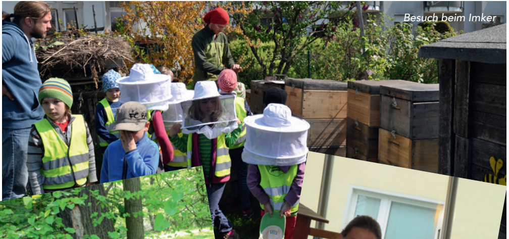
Besuch beim Imker