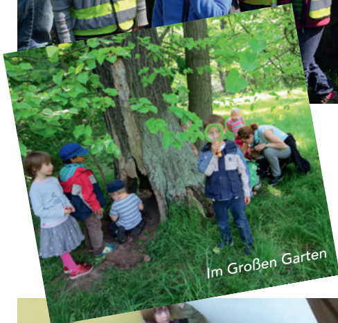
Im Großen Garten