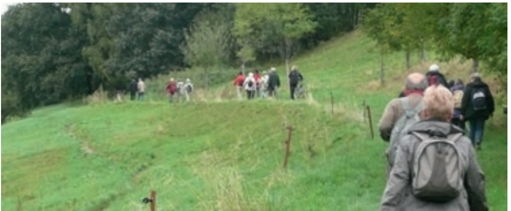
„Eine Herde“ im Grünen – unsere Ökumenische Wanderung 2013 von Mockritz durch den Nöthnitzgrund nach Goppeln.