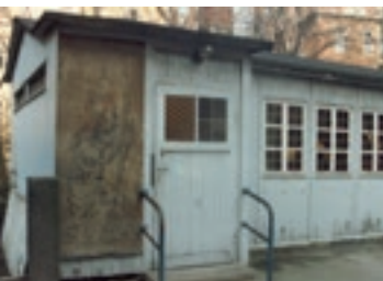
Das Gartenhaus 1988