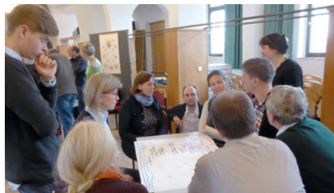
Diskussion im Zschachwitzer Gemeindehaus

Viele Meinungen über die Kirche gab es Mitte März beim Gesamttreffen unserer Verantwortungsgemeinschaft Johannstadt-Striesen-Zschachwitz im Gemeindesaal auf der Meußlitzer Straße: Die Kirche muss mit den Schwachen der Gesellschaft reden und den Kindern zuhören; sie muss auf die Glaubenslosen zugehen und Ort für Asylsuchende sein; sie muss Antworten auf die Frage nach den Glaubenswerten geben und gute Gemeinschaft der Gläubigen sein; sie muss Barmherzigkeit üben in einer Gesellschaft, die diesen Begriff kaum noch kennt. Die rund 35 Teilnehmer aus allen drei Gemeinden und weiteren dort beheimateten kirchlichen Orten tauschten Erfahrungen aus und sprachen in Gruppen über vier vorgelegte Bilder zu kirchlichen Strukturen. In diese Strukturen sollten die eigene