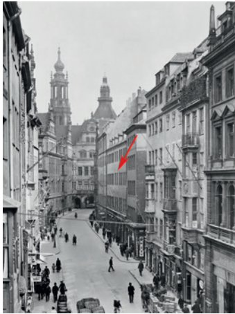
Schlosstraße 32 um 1920

80 - 100 Leute. Hier spielte sich nun hauptsächlich das Gemeinde- und Vereinsleben ab. Auch die Borromäus-Bibliothek war in dem Haus untergebracht. In der Umgangssprache hieß es: „Wir treffen uns in der Union“, gemeint waren aber nicht die Gaststätte, sondern die Gemeinderäume.