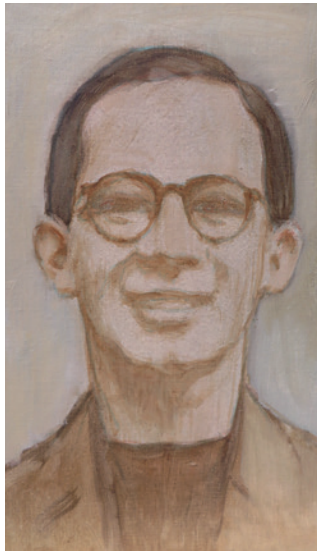
Gemälde im Marcel-Callos-Haus, Heiligenstadt