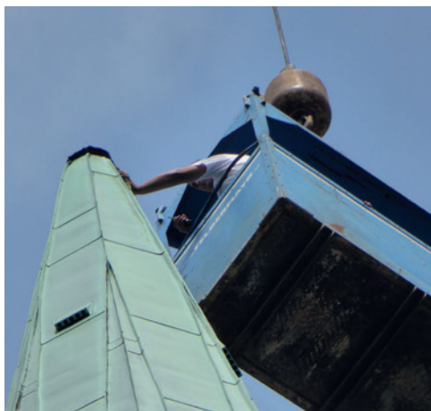
Hoch hinaus: Prüfung der Turmspitze durch die Fachleute

Die Anträge auf Gewährung von Zuwendungen zur Erhaltung und Pflege eines Kulturdenkmales an das Land und die Stadt Dresden sind gestellt. Die daraus resultie-