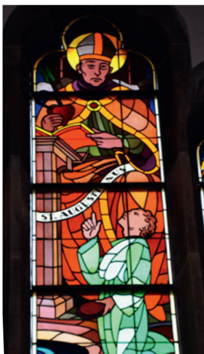
Hl. Augustinus eines unserer Kirchenfenster

Augustinus von Hippo wurde am 13. November 354 in Thagaste im heutigen Souk Ahras in Algerien geboren. Seine Mutter war Christin, sein Vater Anhänger des römischen Götterglaubens. Bereits im Alter von 20 Jahren lehrte er in Thagaste und Karthago (heute ein Vorort von Tunis) Rhetorik. Beeindruckt hat ihn Hortensius , einer für die Philosophie werbende Schrift von Cicero. Da er enttäuscht war, den Namen Christi in dem Werk nicht zu finden, entschloss er sich, in Sachen Weisheit mit Hilfe der Bibel weiterzukommen. Problematisch war für den Rhetor der einfache Sprachstil. Außerdem fand er keine Antwort auf die Frage nach dem Ursprung des Bösen. Die erhoffte er sich daraufhin in der Religionsgemeinschaft der Manichäer zu finden: Dieser Sekte nach stehen sich das Gute und das Böse bzw. die Mächte der Finsternis und des Lichtes als Prinzipien gegenüber und schließen sich gegenseitig aus. Das Unheil sah man in der Vermischung dieser beiden Prinzipien, die Erlösung in der Sammlung des Guten. Augustinus faszinierte der Rationalitätsanspruch der manichäischen Lehre, doch im Laufe seines Studiums der Freien Künste entfernte er sich und 383 wandte er sich von den Dogmen ab. Im selben Jahr lehrte er in Rom, ein Jahr