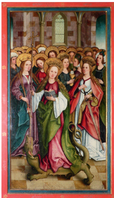
Hl. Margareta auf dem Altarbild der Neithart-Kapelle des Ulmer Münsters

Ein Präfekt fand Gefallen an der jungen Frau und stellte Margareta vor die Wahl, ihn zum Mann zu nehmen oder verhaftet zu werden; sie entschied sich für letzteres. So ließ der Präfekt ihr mit eisernen Kämmen das Fleisch vom Körper reißen. In der Nacht heilten Engel ihre Wunden. Weiter berichtet die Legende, dass sich eines Nachts der Teufel in Gestalt eines Drachens auf sie stürzen wollte. Margareta besiegte ihn, indem sie ein Kreuzzeichen machte, den Drachen auf den Boden warf und ihren Fuß auf seinen Kopf stellte. Licht erstrahlte im Gefängnis auf und gab der