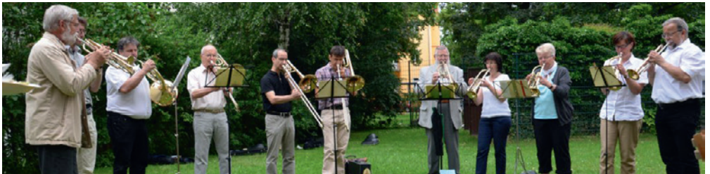
Der Posaunenchor der Johanneskirchgemeinde auf unserem Gemeindefest 2013.