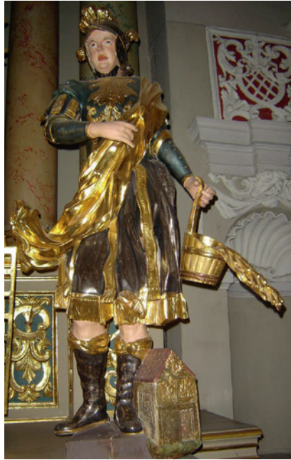
Hl. Florian in der Kathedrale von Vilnius

Florian ist eine Ableitung aus dem lateinischen Florus und bedeutet der Blühende/der Prächtige . Der spätere Märtyrer wurde um 250 n. Chr. im heutigen Zeiselmauer in der Nähe von Wien geboren. Der Überlieferung nach soll er bereits als Kind dazu beigetragen haben, dass ein Brand in wenigen Minuten gelöscht werden konnte. Auch heute noch gilt er als der Schutzpatron der Feuerwehren, und in der Kunst wird er oft beim Brandlöschen dargestellt. Ein weiteres Attribut ist der Mühlstein.