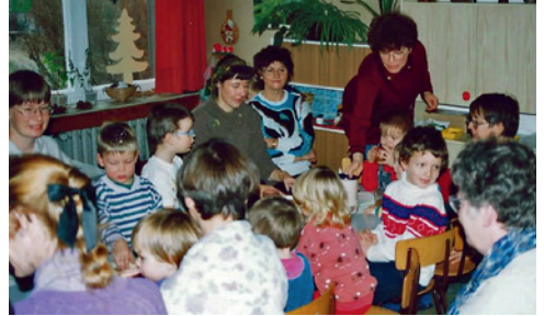
Weihnachtsfeier 1995 im Ausweichquartier Georg-Nerlich-Straße