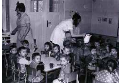
Tee für die „Großen“ in der Kinderkrippe

Ab 6 Uhr morgens wurden etwa 45 Säuglinge und Kinder im Alter von 8 Wochen bis zu 3 Jahren in vier nach Alter gegliederten Gruppen betreut. Für die Wochenkinder – ca. ein Drittel der Knirpse – war es zuweilen hart, wenn die Tageskinder bis 18 Uhr – frisch gewickelt und mit einem Milchvorrat ausgestattet – abgeholt wurden, während es für sie um 19 Uhr nach dem Abendessen ins Bett ging. Höhepunkte im Jahresablauf waren aufwändig vorbereitete Festtage wie Weihnachten, Frauentag, Ostern und 1. Mai oder Besuche beim Striesener Patenschaftsbetrieb der Krippe. Rückblickend erinnern sich die Erzieherinnen daran, dass ein immenses Berichtswesen ihren Spielraum zur Reaktion auf aktuelle Situati-