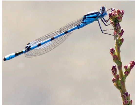
blue – Karsten Rehwald