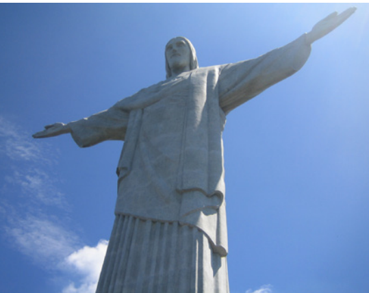
Christus – Clemens van Loyen