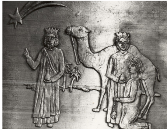
Detail von der Dreikönigsglocke