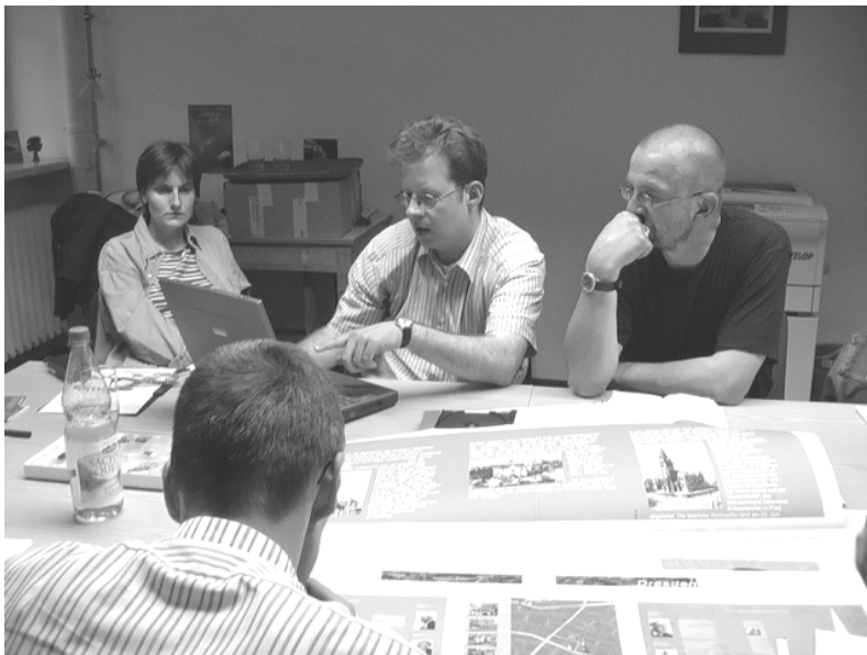
Bei den Vorbereitungen zum ökumenischen Kirchentag